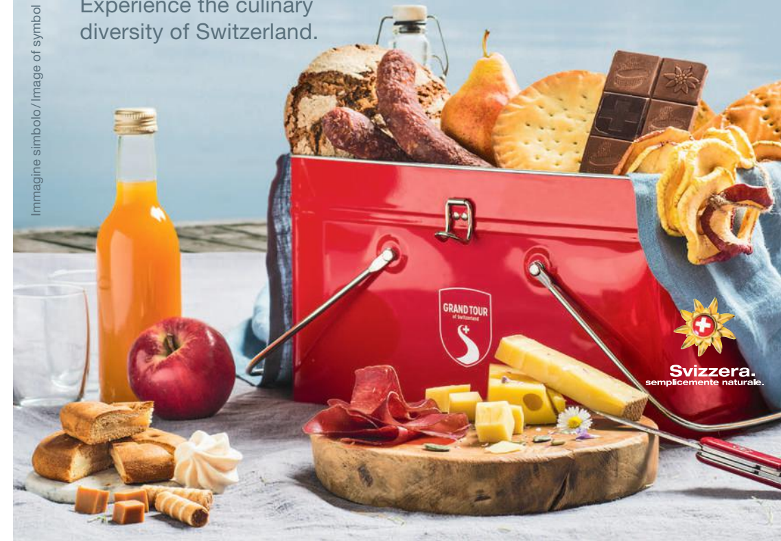
Immagine simbolo / Image of symbol

Experience the culinary diversity of Switzerland.